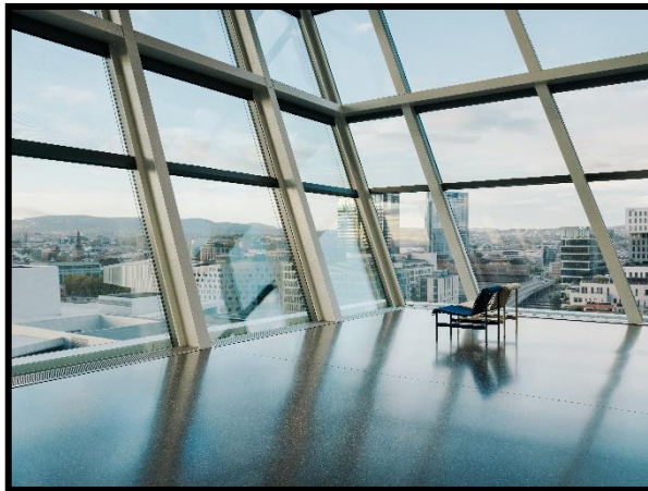
5 Einar Aslaksen/estudio herreros