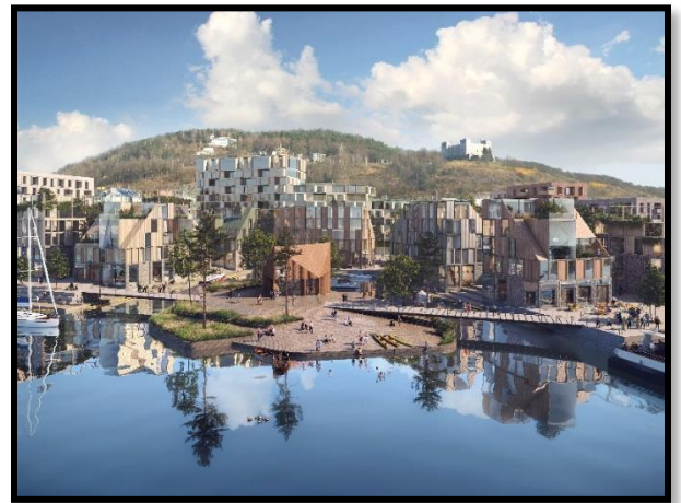
4 Rodeo Arkitekter

Hav Eiendom ønsker å utvikle området etter prinsippene i den økonomiske modellen DOUGHNUT ECONOMICS . Arbeidet skal være et foregangseksempel for hvordan man sikrer bærekraftig stedsutvikling på bydelsnivå, og bidra til å sette ny standard for tilsvarende utredninger og beslutningsunderlag. Arbeidet med Grønlikaia har fått støtte fra Enova. Grønn Byggallianse og FutureBuilt er med som samarbeidspartnere.