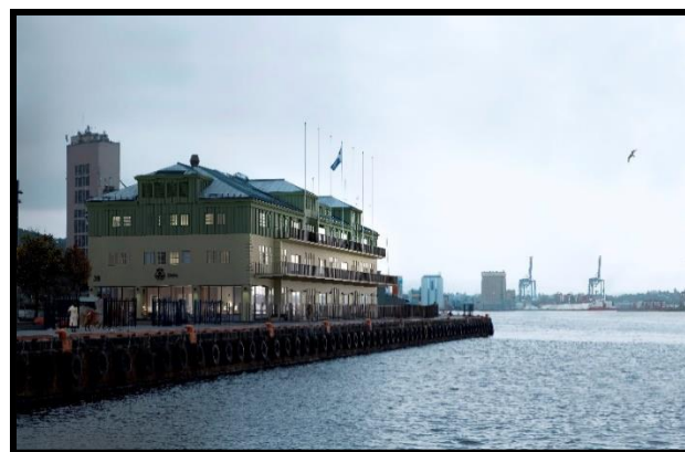
3Spir Arkitekter/Oslo Havn

Skur 38 ble oppført som lager i 1915 og bygget om til hovedkontor for Oslo Havn i 1987. Nå er Oslo Havn i full gang med tidsriktig rehabilitering og innvendig modernisering. Bygget står på Byantikvarens gule liste og er utpekt som verneverdig i Maritim kulturminneplan for Oslo. Men det legger ikke en demper på miljøambisjonene, snarere tvert imot. Bygget rehabiliteres nemlig etter FutureBuilt's sirkulære kriterier.